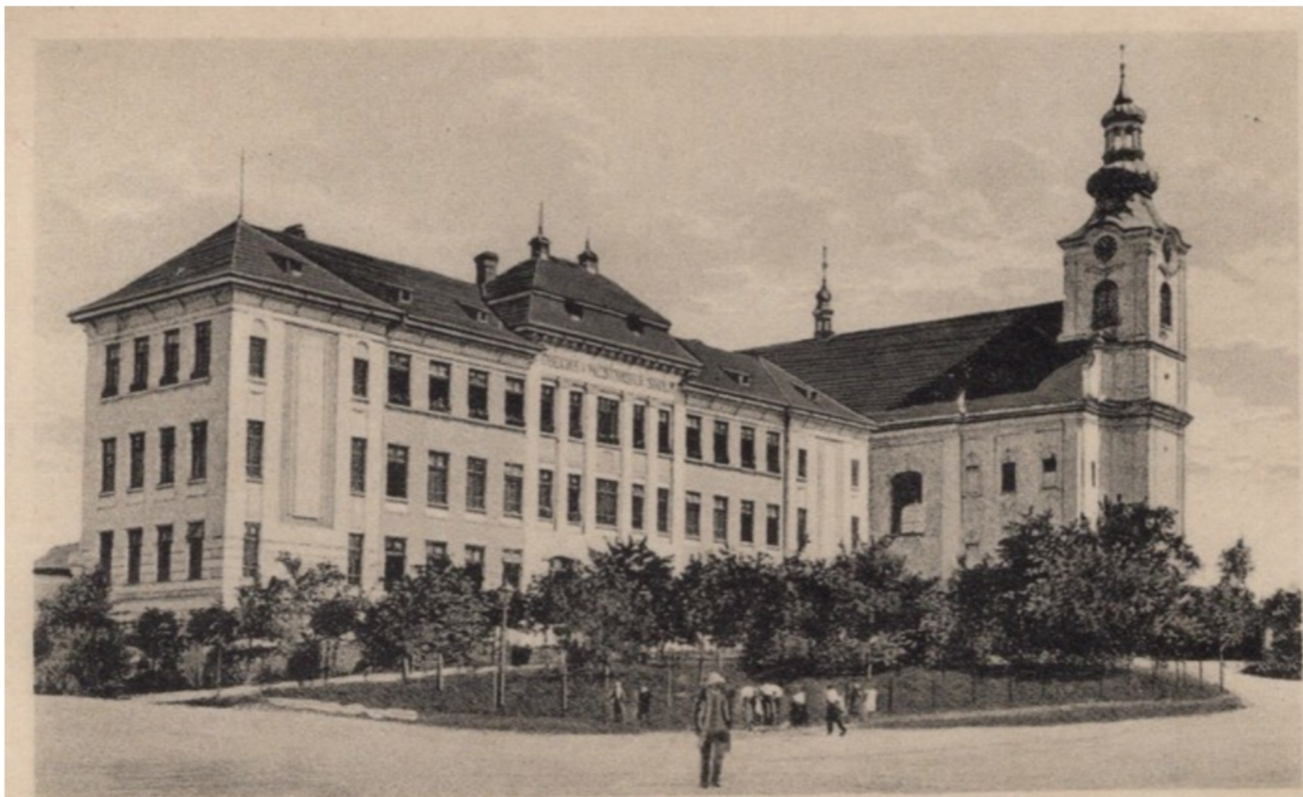
Kostelec na Hané